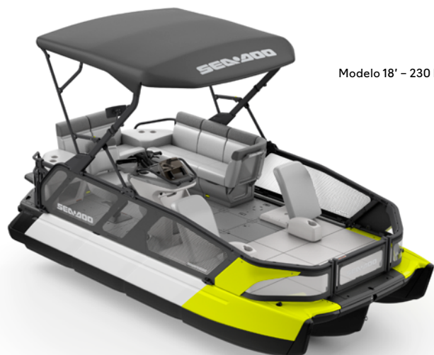
Modelo 18' – 230 hp